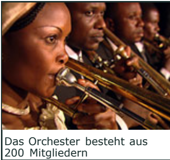
Das Orchester besteht aus 200 Mitgliedern

WDR.de: Der offizielle Titel des Orchesters lautet "Orchestre Symphonique Kimbanguiste" - Wofür steht der Name "Kimbanguiste"?